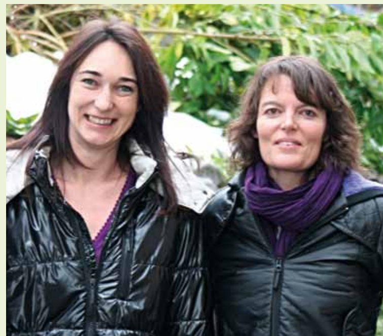
Tout le monde les connaît: elles sont le lien entre les citoyens et les différentes administrations.