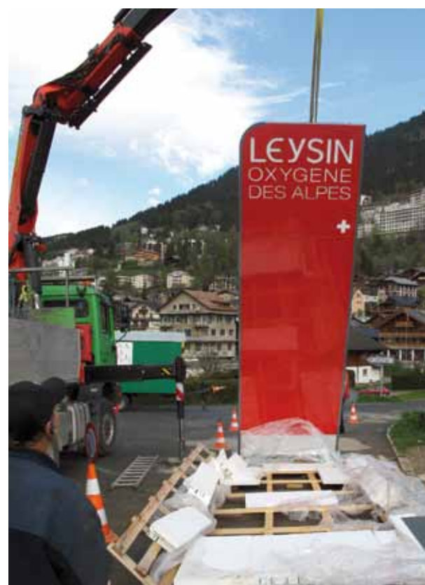
Le lancement du pool marketing coordonné «Enjoy Switzerland» est l'une des plus belles réussites de la législature pour le dicastère de l'économie.