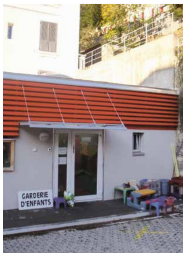
La Commune a acheté le bâtiment de l'ancienne poste du Feydey et y a installé l'Association Arc-en-Ciel, avec également la création de six appartements à loyer modéré. Un projet qui n'était pas gagné d'avance.